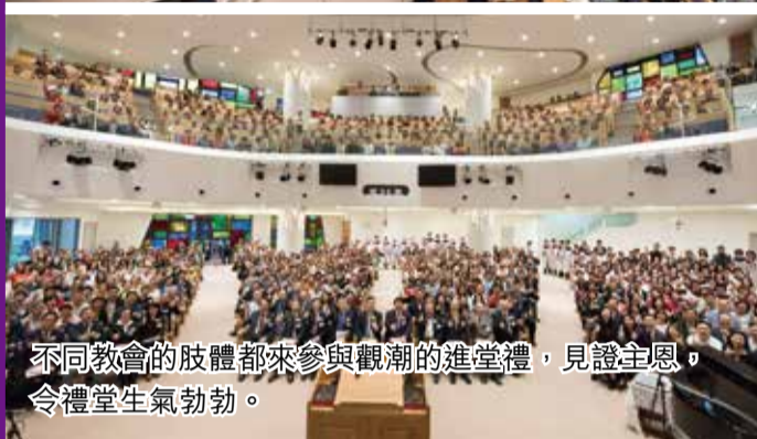
不同教會的肢體都來參與觀潮的進堂禮，見證主恩，令禮堂生氣勃勃。