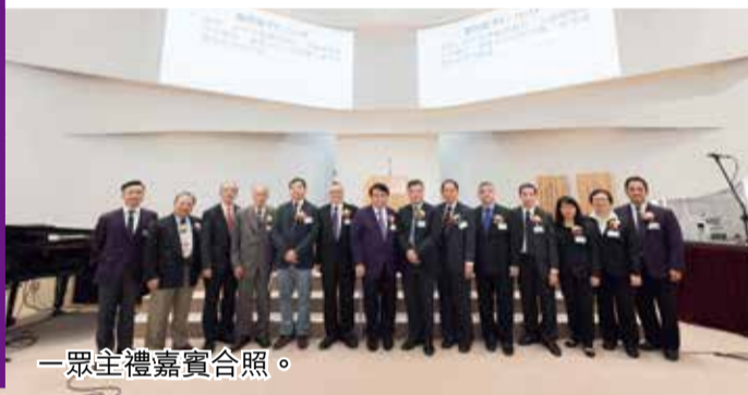
一眾主禮嘉賓合照。