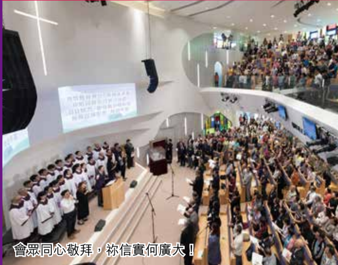
會眾同心敬拜，祢信實何廣大！