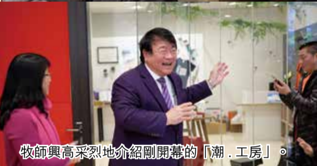
牧師興高采烈地介紹剛開幕的「潮·工房」。