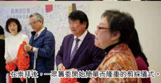
在崇拜後，一眾籌委開始簡單而隆重的剪綵儀式。