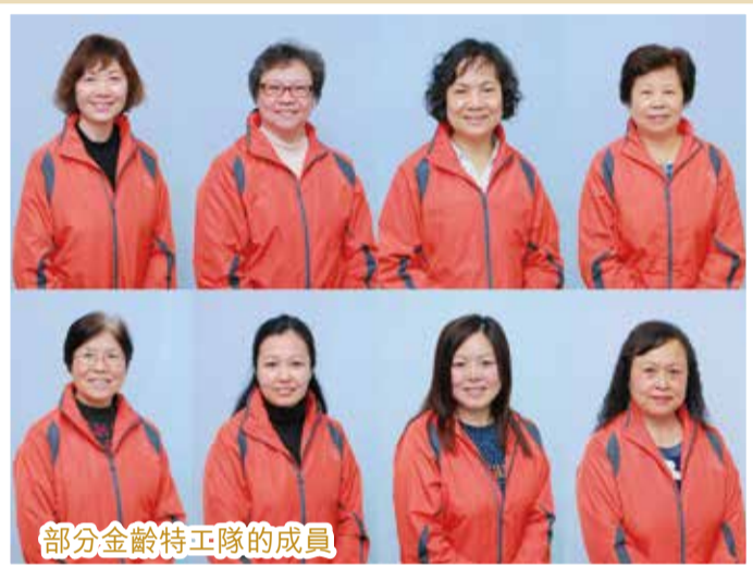
部分金齡特工隊的成員

人害怕自己會老，害怕自己被社會唾棄，但這群忠心愛主和樂於侍奉的弟兄姊妹，絕沒有因自己年紀漸大而放棄任何侍奉機會，反而能從他們面上看到歡喜快樂的笑容。今天，我看到神的恩典臨在他們身上，讓他們繼續以生命影響生命。將來，金齡特工隊將會有更多機會服侍社區，願神繼續祝福他們。