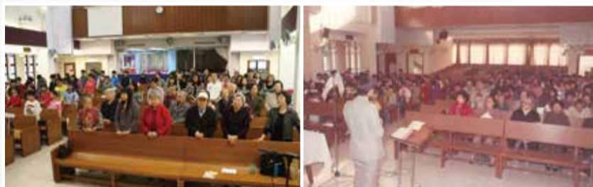
二樓禮堂改裝前（左圖）後（右圖）