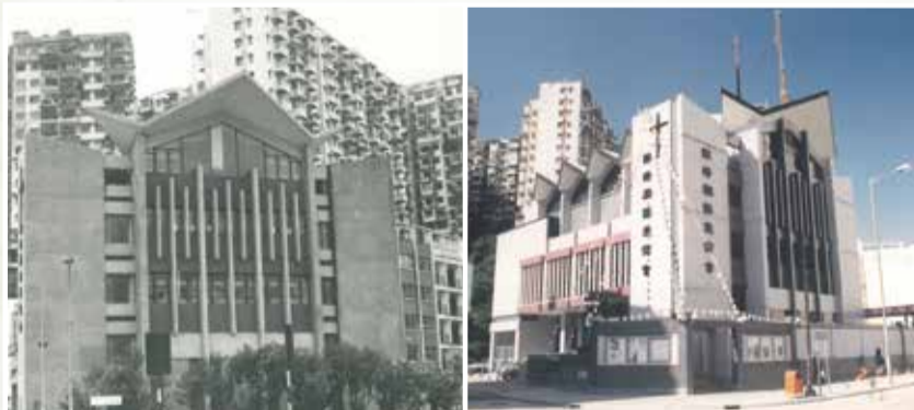
教會外牆修葺前（左圖）後（右圖）