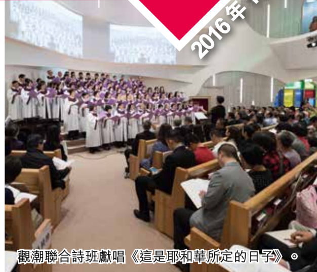
觀潮聯合詩班獻唱《這是耶和華所定的日子》。