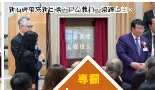
新石碑帶來新目標：建立栽植，榮耀上主。