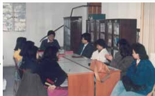
教育樓未拆前用作主日學的課室