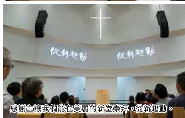
感謝主讓我們能在美麗的新堂崇拜，從新起動。