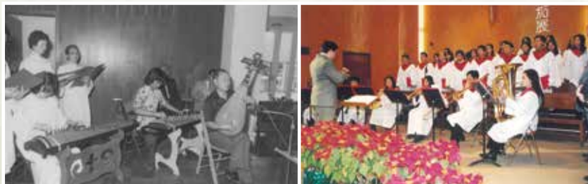
中樂團（左）與管樂隊（右）

自「教會事工研究小組」成立後，教牧同工連同一眾在觀潮長大的領袖一同尋求與策劃觀潮事工發展新的方向與異象。除了對外的佈道、宣教發展外，教會更於對內各式各樣的事工發展上有著更具體與前瞻性的計劃。於崇拜事工上，為讓新一代更能夠投入崇拜，教會增設了純粵語的崇拜，亦成立不同時段與年齡群體的崇拜得以容納更多弟兄姊妹，以及他們的需要。 1 於聖樂發展上，除了繼續詩班的培育外，教會更開設多個樂器隊，包括銀樂隊和中樂隊等等，並嘗試使用不同類型的詩歌敬拜方式，令更多弟兄姊妹參與其中，一同以樂載道讚美主。培訓方面，主日學持續地成為弟兄姊妹研習神話語中不可或缺的一個途徑，觀潮添置圖書館提供多角度的讀物給弟兄姊妹，更成立文字部，出版不同刊物。 2 另外，為更貼近弟兄姊妹生活上牧養的需要，教會重視團契與助導會的發展，亦推動細胞小組、輔導小組（如：婚前輔導），讓弟兄姊妹建立關係。 3